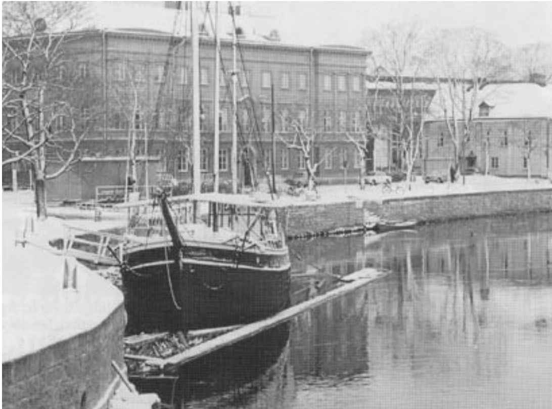
Fartyget m/s Sonja av Hamburgsund som under 1960-talet fungerade som kaffeservering vid Residenstorgets kaj. Hon var ett mer hänsynsfullt inslag i stadsbilden än den anskrämliga "Pråmen" som numer brutalt skämmer stadens finrum.