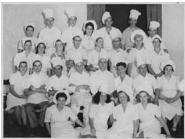
Bilden av Stadshotellens kockar och kallskänkor är från mitten av 1900-talet och återfinns i "Smaka på husen i Karlstad" som gavs ut vid Kulturhusens Dag 2008.

Förutom de som nämnts ovan bidrog ytterligare enskilda personer och medarbetare inom de olika medverkande föreningarna och organisationerna på olika sätt med sitt ideella arbete och engagemang för att göra Kulturhusens Dag till ett uppskattat och välbesökt arrangemang. Sammanlagt har ett 30-tal personer varit involverade i förberedelser och genomförande som med gemensamma krafter