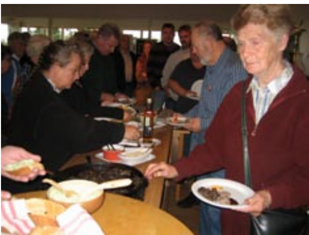
Hackkorvsprovning hos Bola på Terrassen.

På Restaurang Terrassen visades även fotoutställningen Svunna miljöer för mat och dryck med bilder ur Värmlands Museums arkiv. Här kunde åskådarna genom Dan Gunnars foton återuppleva ett tjugotal karlstadsmiljöer och hus som byggts för framställning, tillredning och utskänkning av mat och dryck, bl a interiörer från Grands matsal och Kooperativa i Mariedal som de såg ut på 1930-talet samt Karlstads Spisbrödsfabrik som låg på Långgatan 31 under åren 1910 – 1935.