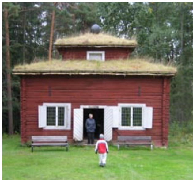
Jakt- och fiskestugan i Mariebergsskogen som av vissa kallas Karl IX:s jaktstuga uppfördes ursprungligen på Kummelön under 1700-talets sista tredjedel. Den kan således inte ha nyttjats av Karl IX som levde 1550 - 1611.