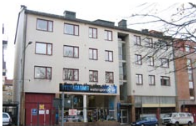
Funkishuset vid Norra Strandgatan 7 är ett av de hus som beskrivs i den första utgåvan av föreningens skriftserie "Karlstad med kulturhistoriska ögon".