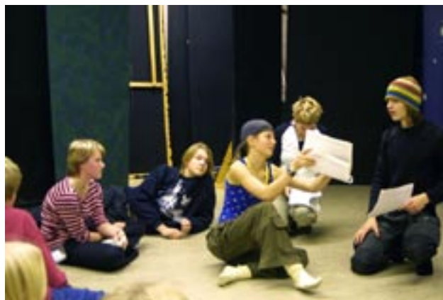
Dramalektion för Tingvallagymnasiets elever i Järnet.

Kursverksamheten i Studieförbundets regi var mycket omfattande och bedrevs såväl på dagtid som på kvällar och helger i Gjuteriets lokaler. Cirklarna omfattar vitt skilda ämnen som flugfiske, jakt, fåglar, turism, hundar, stadsmiljö, måleri, orkidéodling, sociala frågor, mm. Som exempel kan nämnas att bildmåleri utövades av hela 8 grupper varje vecka och att 40-talet blivande jägare genomgick utbildning för jägarexamen. Dessa hade till och med möjlighet att öva skytte i lokalerna med hjälp av de två simulatorer som finns för ändamålet. Genom omdispositioner av lokaler kunde även en mindre slöjdsal utrustas där 20-talet knivslöjdare kunde utöva sitt hantverk under året.