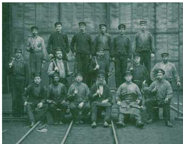
Smederna som ingick i personalstyrkan på Gjuteriet runt 1890.

Ytterligare en konstutställning genomfördes i slutet av maj av elever från årskurs 3 vid Herrhagsskolan som visade sina bilder i anslutning till cafélokalen. Utställningsverksamheten, som nu pågått i tjugo år, har blivit ett uppskattat forum för många amatörbildskapare. Några av utställarna har också arrangerat vernissager vilket lockat nya besökare till Gjuteriet och lokalpressen har vid flera tillfällen uppmärksammat utställningarna med artiklar och recensioner.