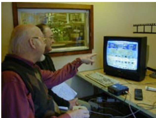
Redigering i Värmlands Filmförbunds videoverkstad.

Värmlands Filmförbunds videoredigeringsstudio har utnyttjats flitigt av medlemmarna såväl dagtid som sent in på nätterna. Bokning av redigeringsstid, videokameror samt utlämning av nycklar och utrustning sker som tidigare till Filmförbundets 70-talet medlemmar via Café Gjuteriet enligt överenskommelse med klubben.