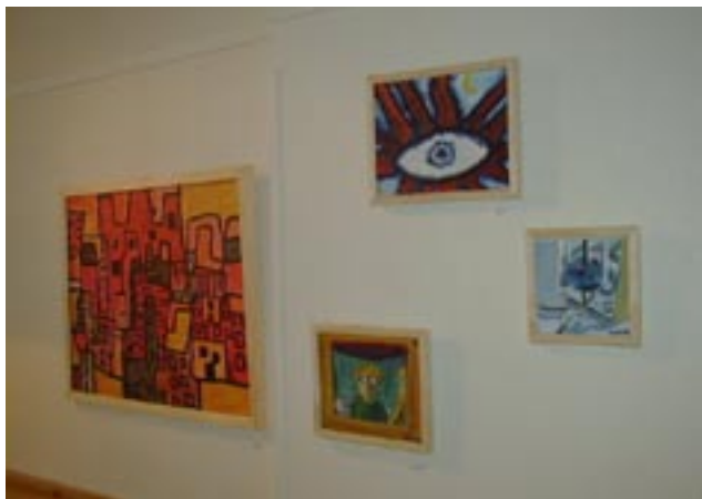
Bildutställning i Café Gjuteriet.