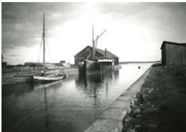
Vågmästarkajen runt 1940. Ångbåten "Daga" ligger förtöjd vid kajen och bakom henne skymtar järnvägen som revs i slutet av 1950-talet.