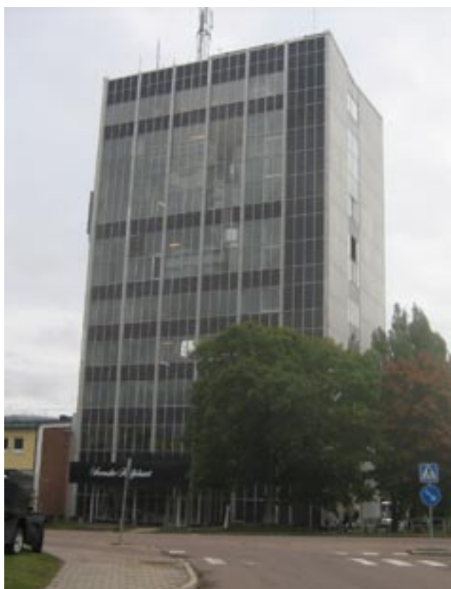
Den 42 meter höga kaffeskrapan uppförd 1960 efter ritningar av Wästlunds Arkitektbyrå.

väg från böna till kopp, en process som börjar i toppen av byggnaden där böna rostas och mals på sin väg ner till paketeringen i bottenvåningarna. Här fick besökarna bl. a. veta att Löfbergs Lila varje dag producerar motsvarande en kopp kaffe till varje svensk (9 milj koppar). Även orsaken till den ångpuff som stiger upp från byggnaden var sjätte minut och sprider den välbekanta doften av ny rostat kaffe över staden fick sin förklaring. När böna är färdigrostade måste de nämligen snabbt kylas för att inte bli överrostade. Den hastiga nedkylningen sker med vatten vilket resulterar i ett kaffedoftande ångmoln. Trots att besökarna på grund av hygienkrav inte kunde vandra runt i själva produktionslokalerna fick de tack vare de kunniga ciceronerna ändå en god bild av företaget Löfbergs Lila och en intressant beskrivning av hur kaffeproduktionen går till. Sammanlagt utnyttjade 130 personer möjligheten att smaka på kaffeskrapan under dagen.