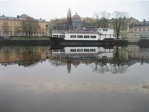
Klarälvens vattenspegel och öppna stränder är en unik tillgång som ger Karlstad dess identitet och karaktär och borde därför göras till stadspark för att fredas från exploatering.