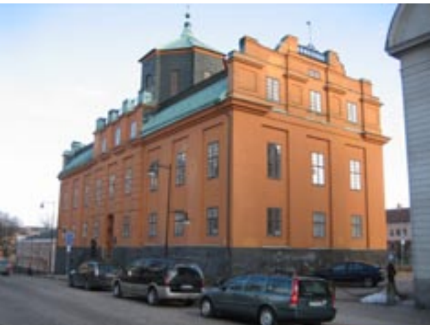
Gamla Gymnasiet som invigdes 1759 är en av stadens mest värdefulla byggnader. Den blev därför föremål för ett av cirkeldeltagarnas studiebesök under våren.