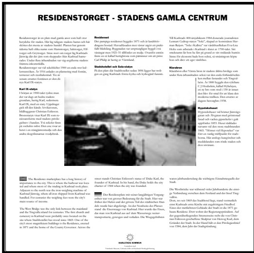
Den ännu inte uppsatta informationsskylten för Residenstorget med omnejd.

Stadsbyggnadskontoret, Kultur- och fritidsförvaltningen, Tekniska verken, Carlstadsgillet, Karlstads hembygdsförening och Värmlands Museum. Under året har en skylt färdigställt för Residenstorget. Den invigdes provisoriskt i samband med firandet av Kulturhusens dag. I avvaktan på att finna den lämpligaste platsen för skyltens placering har den ännu inte satts upp permanent. Gruppen arbetar för närvarande med stadsdelskyltar till Rud, Råtorp och Viken samt skyltar för dykdalberna i Klarälvens östra gren, Sandgrundsudden, Stadsträdgården och Lagberget, där domkyrkan ligger.