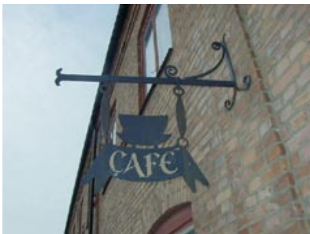
Café Gjuteriets fasads skylt är smidd av konstsmed Örjan Holm.

Administrations- och fastighetskostnaderna blev 56 tkr lägre än budgeterade. Merparten av minskningen utgör minskad fjärrvärmeförbrukning samt att visst underhåll och reparationer i större utsträckning kunnat utföras i egen regi istället för av anlitate entreprenörer. Extraordinära intäkter och kostnader utgör i huvudsak ersättning för inköp för hyresgästernas räkning (uppgifter i Eniros telekatalog, nyttjande av bredbandsuppkoppling, mm) och motsvarande ersättningar från dessa samt ersättning från Sporthallen Gjuteriet för nyttjande av Gjuteriets sopcontainer och skatteåterbäring för år 2005 och 2006. Sammantaget innebär budgetavvikelseerna att Gjuteriet uppvisar ett resultat som är 35 tkr bättre än det förväntade.