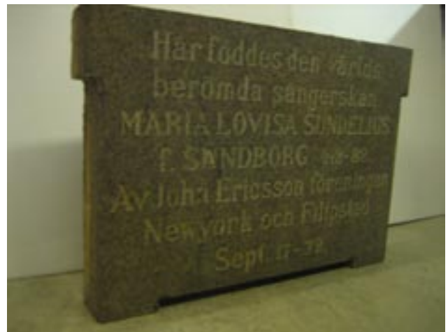
Den återfunna minnesstenen är ett bastant garnitblock med måtten 67 x 46 x 9 cm med en vikt på nära 50 kg.

Såväl NWT som Karlstads Tidningen fann historien om minnesstenens äventyr med sitt lyckliga slut så intressant att man delgav läsarna denna genom artiklar som de båda tidningarna publicerade i december.