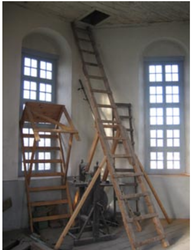
Studiecirkeln besökte bl. a. observatoriet i Gamla Gymnasiet åttkamliga torn som annars inte är tillgängligt för allmänheten.